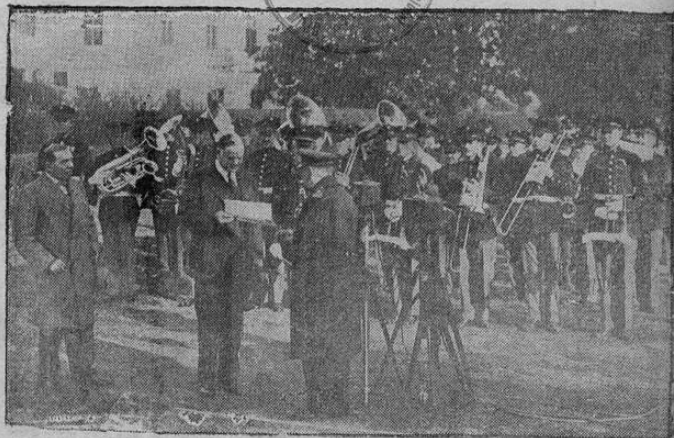
John Philip Sousa, notable director de bandas y famoso compositor presentando al presidente Hoover su última composición, la marcha "Bi-centenario Jorge Washington", después de que hubo tocado por primera vez la banda de la marina de los Estados Unidos en la Casa Blanca, en Washington, D. C.